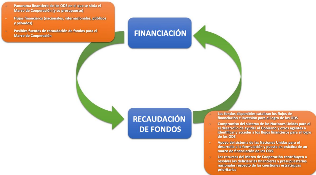
Figura 2: Estrategia de financiación y recaudación de fondos del Marco de Cooperación

que describa las contribuciones de las Naciones Unidas en consonancia con los principios para la participación en la financiación de los ODS.